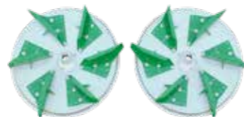
Discos para produtos em pó

Para a troca dos discos não são necessárias ferramentas, pois são fixados por dois parafusos com manípulo, um para cada disco.